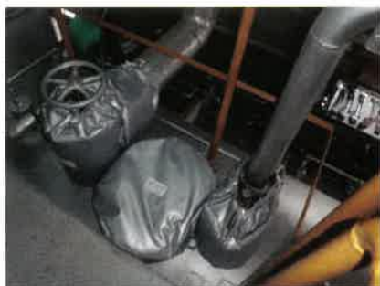
特殊形状バルブ、蓋用