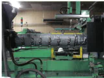
樹脂押出成形機用