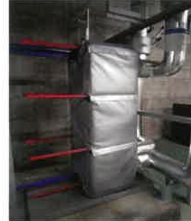
プレート熱交換器用